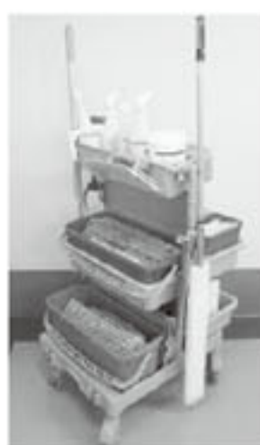
商品名：ESカート サイズ：縦50×横70×高さ106cm 定価：68,500円 ※写真はイメージです。

以上、簡単ではございますがお勧め製品の紹介です。感染対策清掃のお役に立つ事が出来れば幸いです。ご検討の程宜しくお願い致します。