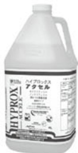
商品名：ハイプロックスアクセル サイズ：4L 定価：7,000円