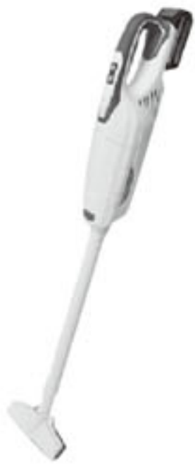
ワイルドブリーズ

2013年の発売以降ご好評頂いております、コードレスハンディクリーナー「ブリーズ」の強力タイプ「ワイルドブリーズ」が発売開始となりました。