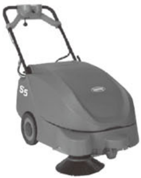
S5手押し式スイーパー

ツインブラシでごみの回収能力を大幅UPさせています。最大稼働3時間。カーペットにも使用可能です。